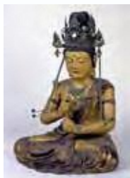
大日如来坐像(智恩寺)

「切戸の文殊」で知られる智恩寺所蔵の文化財を通して、日本海を通じた大陸との交流や往時の政治権力との関わりなど同寺の歴史を探ります。