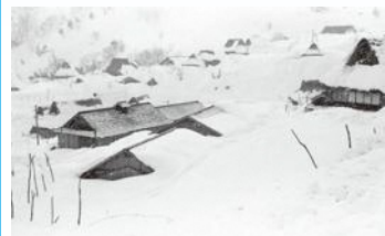
サンパチ豪雪 昭和38年撮影

昭和38年(1963)の記録的大雪=サンパチ豪雪から60年。関連資料から丹後の山村生活や離村の実情に迫り、暮らしの豊かさとは何かを考えます。