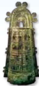
袈裟禪文銅鐺(梅林寺)

丹後に生きた人々の願いが込められた貴重な文化財の数々を一堂に展覧し、先人の多様な祈りのカタチを探ります。