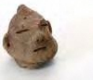
温江遺跡出土 人面付き土器

丹後には「あやしい」ものがいっぱい!? 伝説や伝承にまつわる不思議なもの、得体の知れない出土品など、あやしくて面白い逸話を紹介します。